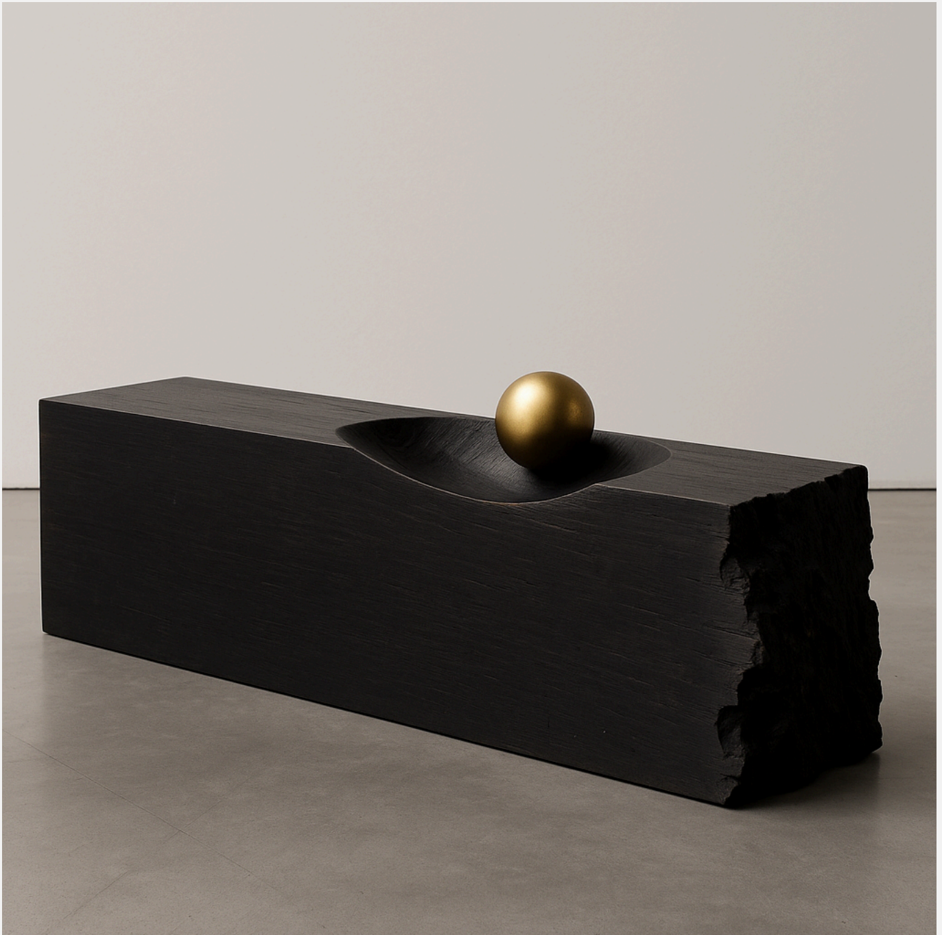
Limite do Imanente — 2026 — Madeira e Latão — 150 x 30 x 45 cm