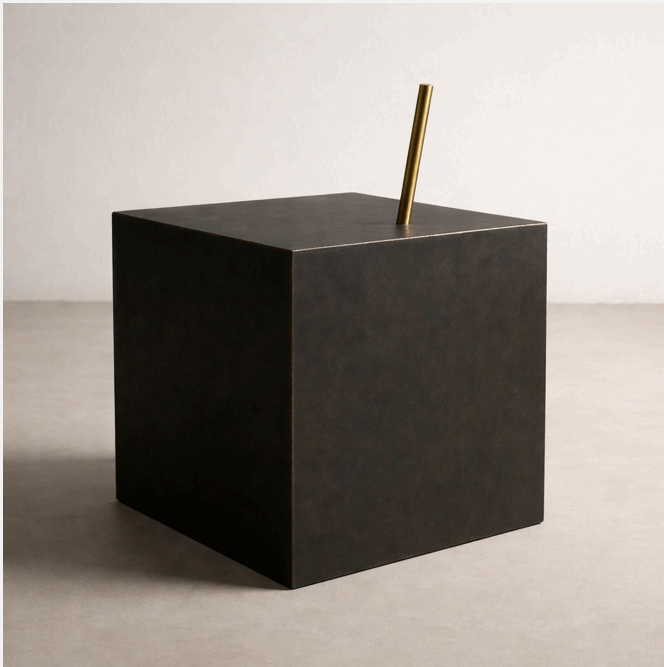
A Centelha — 2025 — Aço e Latão — 50 x 70 x 50 cm