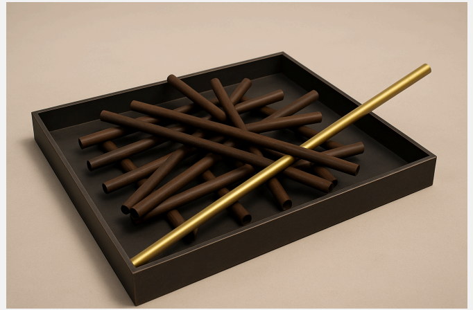
Irreversível — 2026 — Aço, Madeira e Latão — 80 x 80 x 15 cm